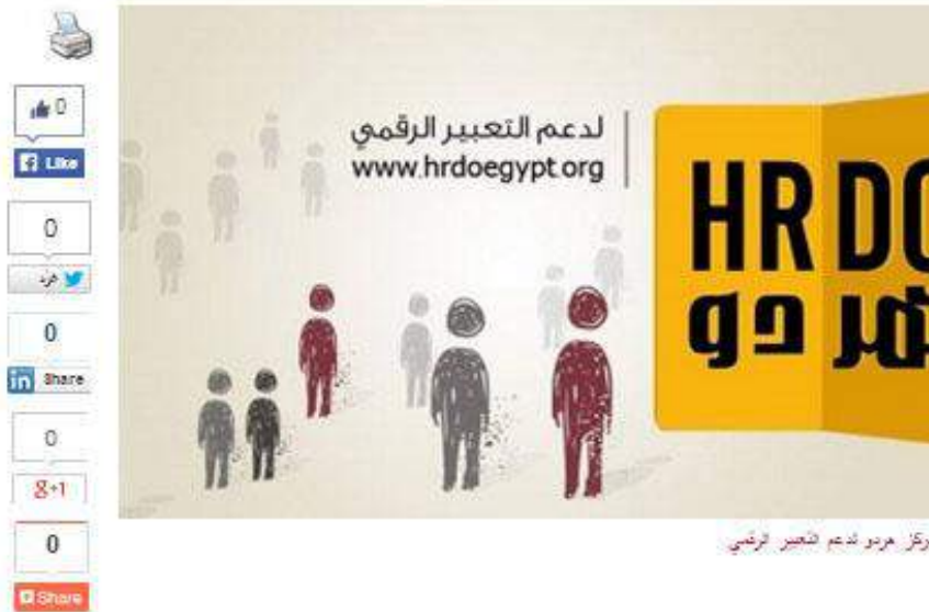
مركز هردو لدعم التعبير الرقمي

أصدر مركز هردو لدعم التعبير الرقمي، اليوم الأحد، تقريراً بعنوان "أزمة المجتمع المدني ومؤسسات الدولة"، يتناول موقف المجتمع المدني من التعديلات التشريعية حول قانون الجمعيات الأهلية، مع استعراض لفكرة المؤسسات الأهلية في مصر وأهميتها للمجتمع وبدائيات التضييق عليها، سواء بإلغاء القيد على العاملين بالمجتمع المدني، أو إلغاء التهم الحزبية بالعمالة والخبثية والتمويل من الجهات الأجنبية.