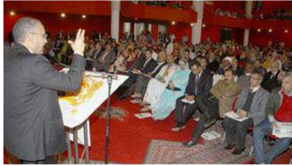
كتبت : نهى عبد اللطيف

أصدر مركز هردو لدعم التعبير الرقمي تقريرا بعنوان " أزمة المجتمع المدني مع مؤسسات الدولة" يتناول موقف المجتمع المدني من التعديلات التشريعية حول قانون الجمعيات الأهلية مع استعراض لنشأة فكرة المؤسسات الأهلية في مصر وأهميتها للمجتمع. وبدأت التضييق عليها عن طريق القوانين المعرفلة والادعاءات التعسفية من قبل أجهزة الدولة سواء بإلقاء القبض على العاملين بالمجتمع المدني أو إلقاء التهم الجزافية بالعمالة والخيانة والتمويل من الجهات الأجنبية بغرض قلب نظام الحكم وما إلى ذلك.